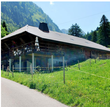
Buvette Les Seythours Allières/Montbovon

Du 1er mai au 1er octobre. Jean-Marie Pittet. Boissons et restauration. Ouvert tous les jours de 10:00 à 23:00. Accessible en voiture. 1669 Les Allières/Montbovon tel. +41 (0)26 928 20 61