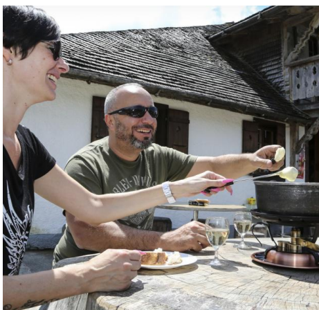
Buvette Chez Boudji Broc

Laurent Buchs. Ouvert samedi et dimanche et sur réservation. Spécialités fribourgeoises. Case postale 254 1630 Bulle tel. +41 (0)26 912 73 75