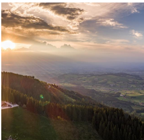
Restaurant Berghaus Gurli Plaffeien

Du 1er mai au 1er octobre. Jean-Marie Pittet. Boissons et restauration. Ouvert tous les jours de 10:00 à 23:00. Accessible en voiture. 1669 Les Allières/Montbovon tel. +41 (0)26 928 20 61