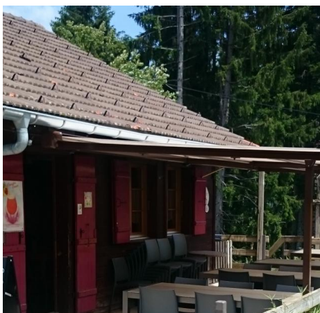
Buvette des Amis de la Chia Bulle

Dans la confortable salle de restaurant, dans le Raclette-Stübli ou sur la terrasse, l'équipe de Gurli vous sert les plats traditionnels faits avec des produits régionaux. Gurliweg 200 1716 Plaffeien tel. +41 26 419 19 13